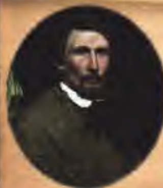
Васнецов Виктор Михайлович (1848-1926)

Анализ фрески вы можете использовать на уроках основ православной культуры по теме «Крещение Руси». Автор «Жития блаженного Володимира» сообщает, что в августе 988 года «люды с радостью идяху, радующеся и глаголюще: аще бы се не добро было, не быша сего князь и боляре прияли».